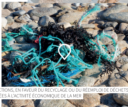
ACTIONS, EN FAVEUR DU RECYCLAGE OU DU RÉEMPLOI DE DÉCHETS, LIÉES À L'ACTIVITÉ ÉCONOMIQUE DE LA MER