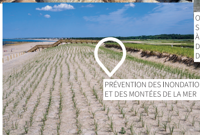
PRÉVENTION DES INONDATIONS ET DES MONTÉES DE LA MER