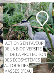
ACTIONS EN FAVEUR DE LA BIODIVERSITÉ ET DE LA PROTECTION DES ÉCOSYSTÈMES AUTOUR DES MASSES D'EAU