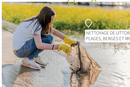
NETTOYAGE DE LITTORAL, PLAGES, BERGES ET RIVIÈRES,